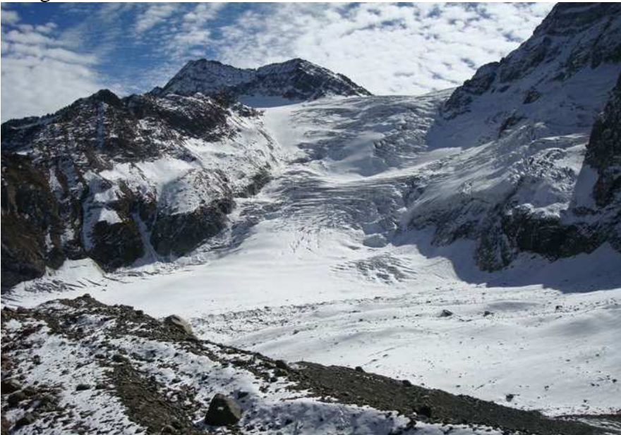
Eystri tunga Kolahoi-jökulsins fellur í myndarlegum jökulfossi niður á leysingarsvæðið

Nýlega hefur að frumkvæði forseta Íslands verið efnt til samstarfs íslenskra, indverskra og bandarískra jöklafræðinga um rannsóknir á afkomu valdra jökla í Himalayafjöllum. Tilgangurinn er meðal annars sá að bæta mat á afrennsli leysingarvatns frá fjöllum og treysta grunn spáa um afrennslisbreytingar í hlýnandi loftslagi á 21. öld. Í þessum mesta fjallgarði jarðar skipta jöklar þúsundum og alls þekja þeir ríflega 30,000 km 2 lands. Jöklarnir hafa stöðugt rýrnað og hopað frá 19. öld og er talið hugsanlegt að þeir hverfi að verulegu leyti á næstu 3-4 áratugum.