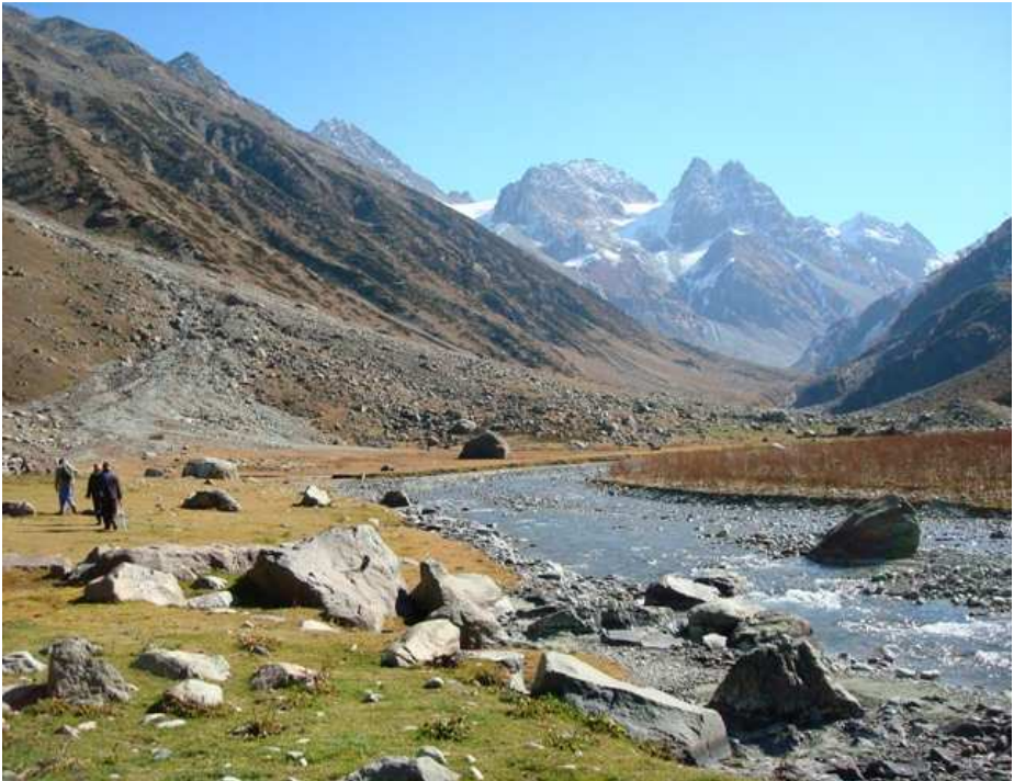
Gengið inn eftir Liddar-dalnum í Kashmir. Kolahoi-jökullinn er í hvarfi innst í dalnum.

Þriggja daga gangur er að jöklinum frá næstu byggð og slógu leiðangursmenn upp búðum við jökuljaðarinn í 4000 metra hæð. Kannaðar voru aðstæður til göngu upp á ákomusvæði jökulsins, sem teygir sig upp undir 5000 m hæð. Stikur voru boraðar í jökulís á leysingarsvæðinu og þversnið mæld með GPS tæki á nokkrum stöðum.