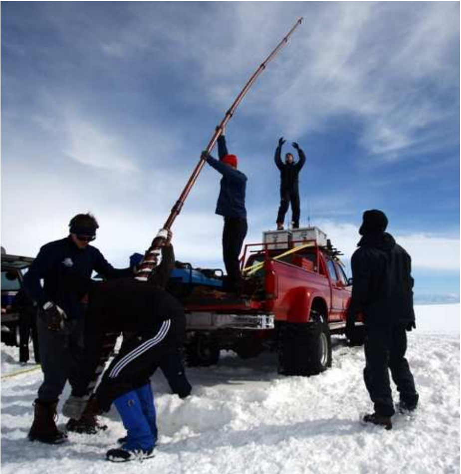
Vaskir menn við afkomumælingar á Mýrdalsjökli 2007