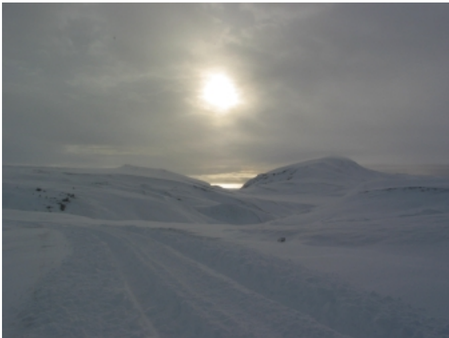
Af Stóradalsheiði

Gjaldskráin var samþykkt á stjórnarfundum þann 12. janúar 2004.