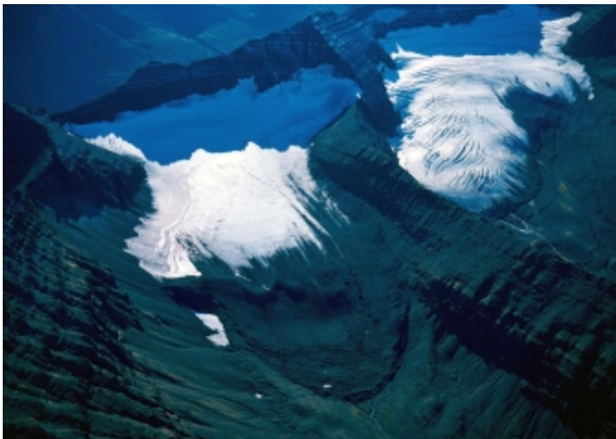
Búrfellsjökull (t.h.) í Svarfaðardal 15. september 2003 allur sprunginn við það að hlaupa fram. Teigardalsjökull (t.v.) nánast sprungulaus en hann hljóp fram árið 1971. Þetta eru tveir minnstu framhlaupsjökklar sem þekktir eru í veröldinni.