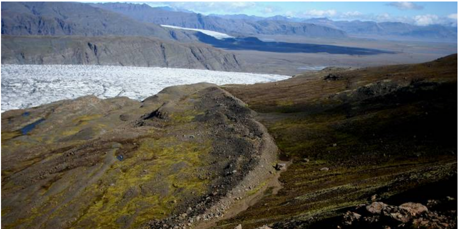
Jökulgarður í Skálafellshnútu.