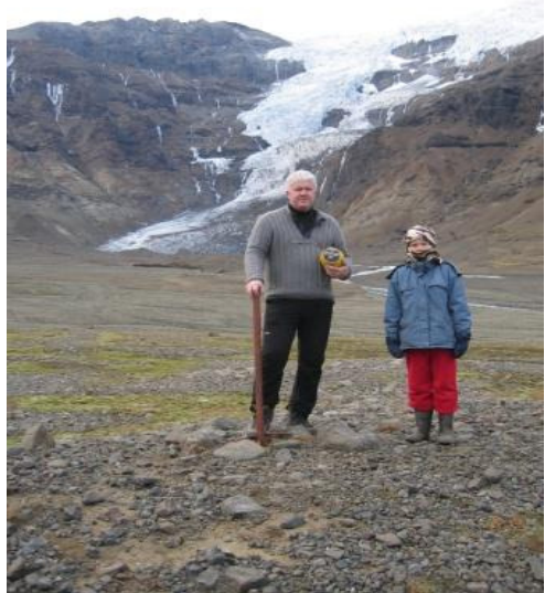
Brókarjökull sýnir augljós merki heimshlýnunar. Svona slitróttur hefur hann ekki sést um aldri og er stutt í að hann hætti að ná niður á jafnsléttu. Myndin sýnir mælingamenn við jöklamerki nr. 162. Ljós. 23. október 2010, Sigurlaug Sigurjónsdóttir.

Búið er að vitja um 50 mælistöðva fyrir árið 2010. Niðurstöður eru óvenju samhljóða þetta árið. Einn sporður gekk fram frá fyrra ári, einn stendur í stað en allir hinir styttust. Þetta er í góðu samræmi við ástandið. Sumarið var með þeim allra hlýjustu sem komið hafa í sögu veðurmælinga og ofan á það bættist öskusáldur frá Eyjafjallajökli. Það jök leysingu til muna á flestöllum jöklum en þó ekki Eyjafjallajökli og Mýrdalsjökli þar sem askan var svo þykk að hún einangraði jökulinn. Til þess þarf ekki nema fárra millimetra lag af ösku. Þetta varð til þess að nær allar jökulár á Íslandi voru vatnsmeiri en áður hefur mælst nema þær sem koma frá Mýrdals- og Eyjafjallajökli svo sem Markarfljót.